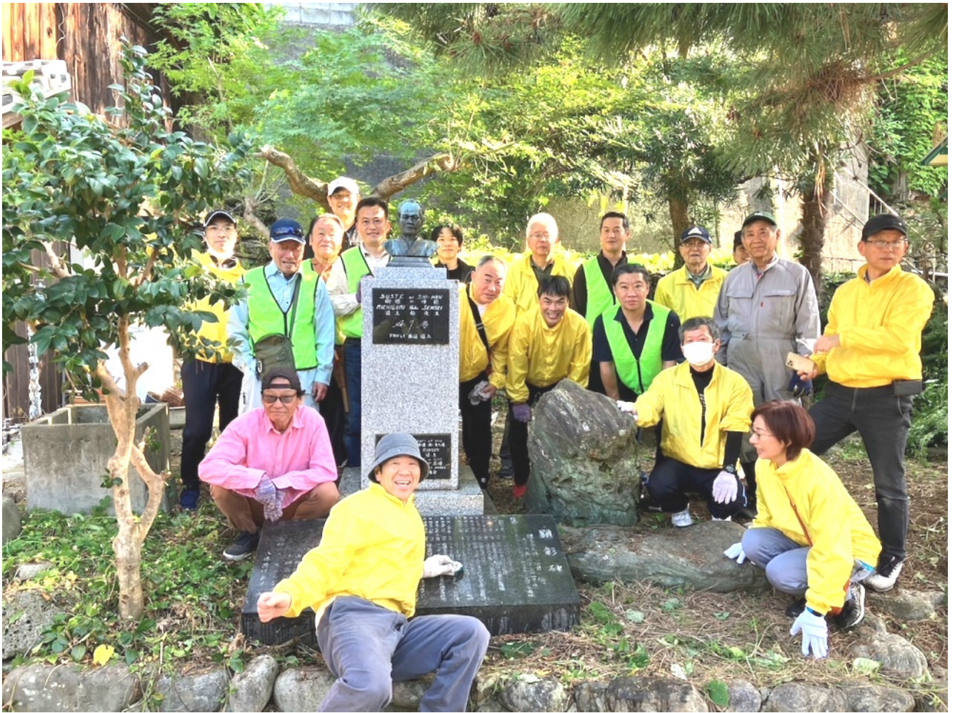
道上伯銅像清掃大作戦